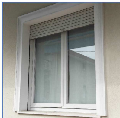
Foto vista dall'esterno