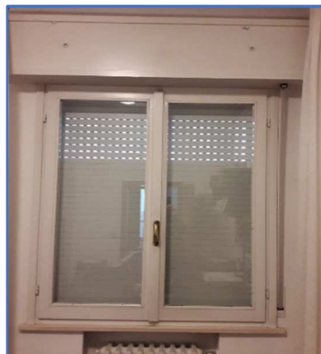
Foto vista dall'interno